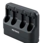
电池用 4 连充电器 BT-WCG14 (附带 AC 适配器)