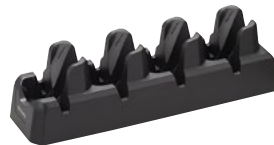
4 连充电底座 BT-WUC84 (附带 AC 适配器)