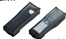
● 软包 OP-87387