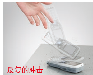
耐日常发生的冲击