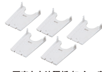
● 可充电电池隔板 (5 个一套) BT-A15