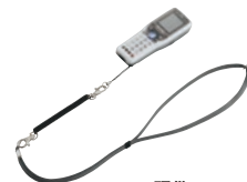
● 颈带 OP-87163