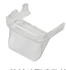
● 接触读取选购件 OP-87386