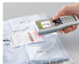
隔着塑料也可高速读取